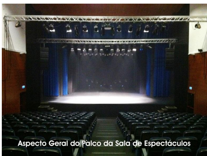
Aspecto Geral do Palco da Sala de Espectáculos