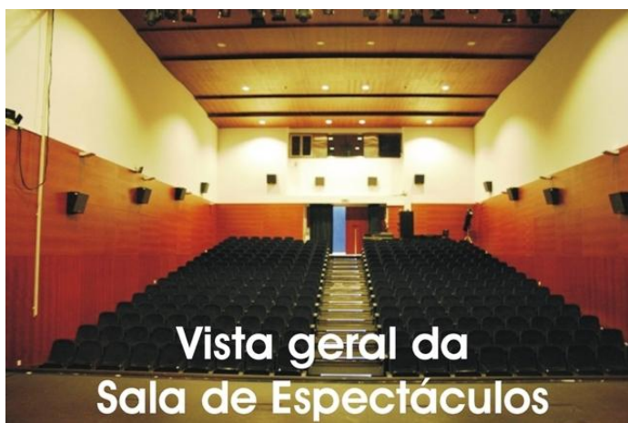
Vista geral da Sala de Espectáculos